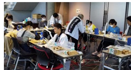
スタンドグラス製作体験