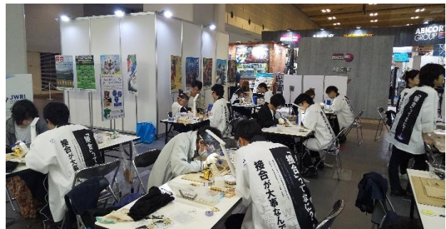
「スタンドグラスをつくってみよう」会場