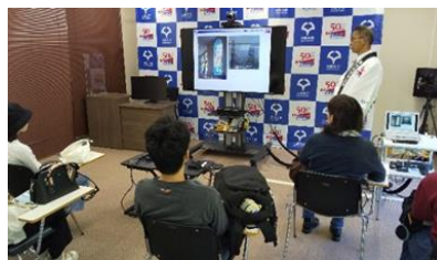
スタンドグラスの歴史講座