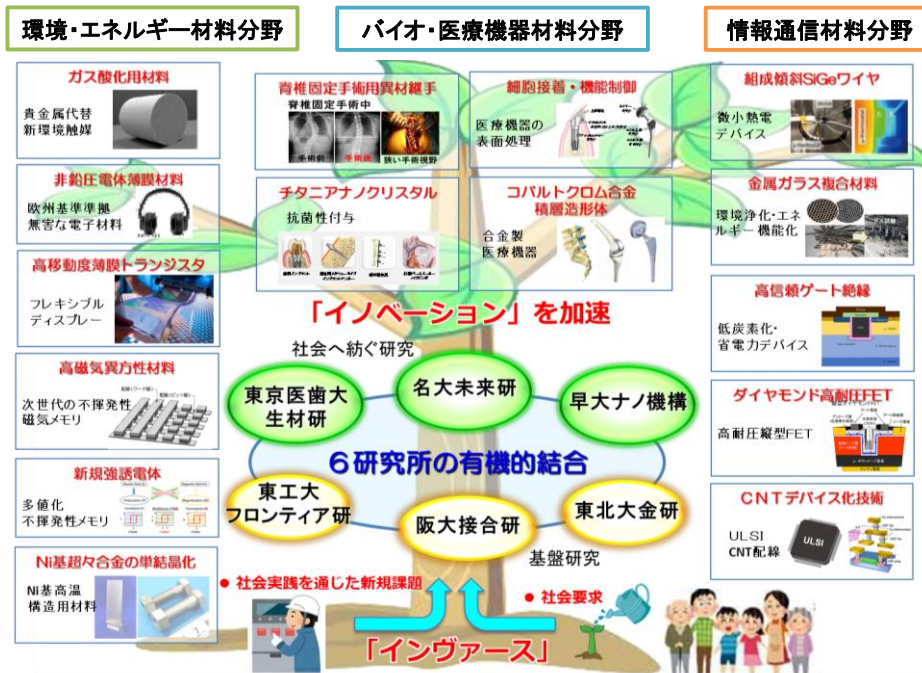
図2 6大学6研究所が連携して推進している出島プロジェクトで実施している研究事例。