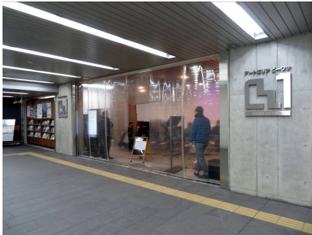
ビニール風防が付いたアートエリア B 1

第 3 回「錬金術師？－金属コーティングの極意－」(平成 30 年 3 月 6 日) も是非ご参加いただければと思います。