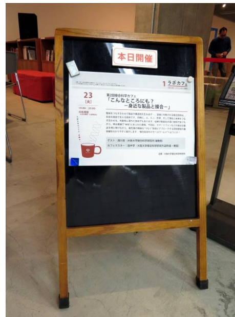
接合科学カフェ案内