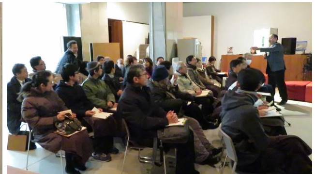
プレゼンテーション風景